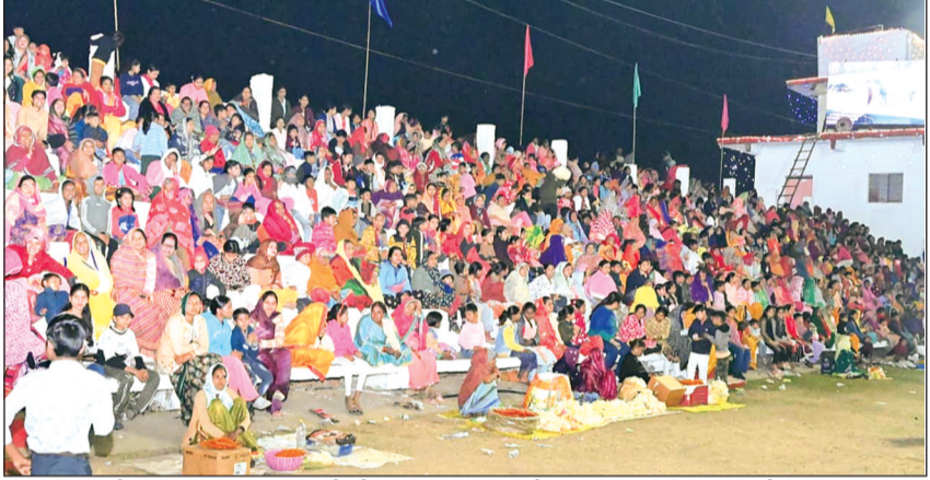
विदिशा। रामलीला मेला परिसर के अंदर ही लीला देखने के लिए करीब 15 हजार लोगों के बैठने की है व्यवस्था।

मकर संक्रांति से प्रारंभ हुए रामलीला एवं मेला आयोजन में सुरक्षा व्यवस्था की लापरवाही सामने आई है। मेले में भीड़ बढ़ती जा रही है और पुलिस की मौजूदगी न के बराबर है। इसी का फायदा उठाकर रात के समय मेले में चोरियां हो रहीं हैं। अब व्यापारी रातभर जागकर दुकानों की पहरेदारी कर रहे हैं। मेले में एक के बाद एक चोरी की घटनाएं घटित हुईं। स्थिति इतनी चिंताजनक रही कि मेला परिसर में स्थापित पुलिस चौकी पर भी कोई पुलिसकर्मी मौजूद नहीं मिला। इससे आमजन में आक्रोश फैल गया और पुलिस