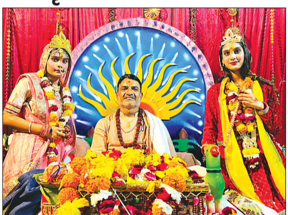
हरिभूमि न्यूज बरेली

कथाओं की नगरी में 27 जनवरी से मानस सत्संग भवन में भवानी रामायण महिला मंडल के तत्वाधान में सात दिवसीय श्रीमद् भागवत कथा ज्ञान यज्ञ कर धामक आयोजन चल रहा है। नगर एवं ग्रामीण क्षेत्र से भारी संख्या में श्रद्धालु नर-नारियों की उपस्थिति हो रही है। कथा व्यास डॉ. भवानी शंकर तिवारी द्वारा श्री