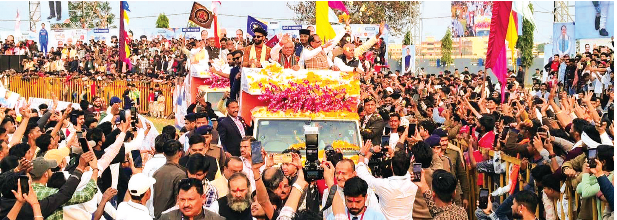
समापन के दौरान खिलाड़ियों का जोश, दर्शकों की भारी भीड़ और मंच पर मौजूद दिग्गजों की उपस्थिति ने आयोजन को ऐतिहासिक बना दिया। जिले में खेल संस्कृति को मजबूत करने की दिशा में यह महोत्सव एक बड़ा कदम माना जा रहा है। 10 हजार से अधिक दर्शकों की उपस्थिति ने किया साबित, खेल की तरफ बढ़ रहा रायसेन