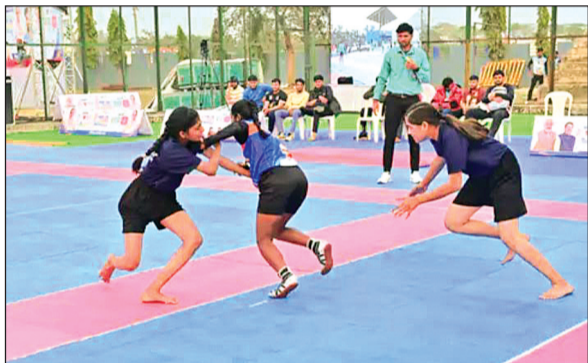
हरिभूमि न्यूज | रायसेन