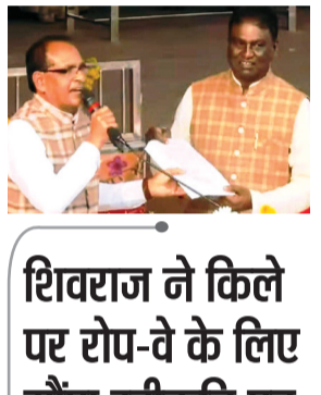
हरिभूमि न्यूज | रायसेन

नगर के खेल स्टेडियम में आयोजित सांसद खेल महोत्सव का सोमवार को भव्य समापन हुआ। समापन समारोह में खेल मैदान से लेकर दर्शक दीर्घा तक उत्साह और जोश का माहौल देखने को मिला। विभिन्न प्रतियोगिताओं में भाग लेने वाली खिलाड़ियों ने अपना दमखम दिखाते हुए शानदार प्रदर्शन किया और दर्शकों को रोमांचित कर दिया। मैदान में लगातार तालियों की गूंज के बीच खिलाड़ियों ने खेल प्रतिभा का बेहतरीन परिचय दिया। रायसेन स्ट्राइगर और सिलवानी टीम के बीच फायनल मैच का रोमांचक मुकामला हुआ, जिसमें रायसेन ने सिलवानी को 5 विकेट से हराकर जीत का परचम लहराया।