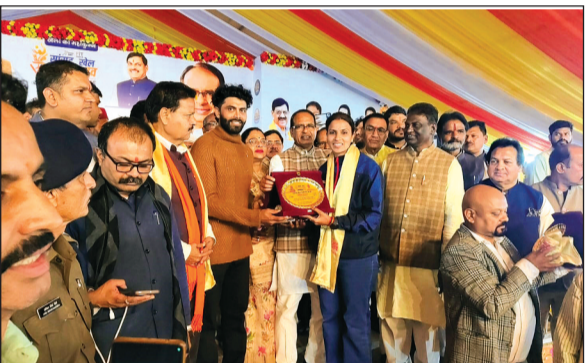
हरिभूमि न्यूज | रायसेन