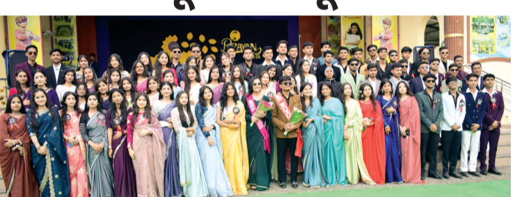
हरिभूमि न्यूज सिरोंज

स्थानीय बस स्टेण्ड स्थित निर्मला कान्वेंट हायर सेकेण्डरी स्कूल में शैक्षणिक सत्र 2025-26 के कक्षा 12वीं के विद्यार्थियों को कक्षा 11वीं के छात्रों के द्वारा समारोह आयोजित कर विदाई दी गई। कार्यक्रम के