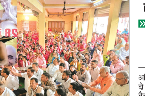
हरिभूमि न्यूज बरेली

नगर के दिगंबर जैन मंदिर और समीप स्थित जैन समाज के सत्संग भवन में 27 जनवरी से 1008 सिद्ध चक्र महामंडल विधान एवं विश्व शांति महायज्ञ का धार्मिक आयोजन चल रहा है। धार्मिक आयोजन में जैन समाज के परिवारों द्वारा उत्साह पूर्वक भाग लेकर विभिन्न कार्यक्रम को संपन्न किया जा रहा है। जैन समाज के चल रहे धार्मिक आयोजन में 108 पूज्य मुनि श्री प्रयोग सागर जी महाराज एवं ह्रुल्लक 105 परित सागर महाराज की विशेष उपस्थिति बनी हुई है। जैन सत्संग भवन में मुनि श्री का 28 वा दीक्षा दिवस समारोह नगर की सकल जैन समाज द्वारा धूमधाम एवं उत्साह पूर्वक मनाया गया। इस अवसर पर जैन मुनि ने कहा कि किसी मनुष्य ने अपना जन्म अपनी आंखों से नहीं देखा परंतु दिगंबर साधु अपना जन्म अपनी आंखों से देखते हैं। मुनि श्री के पाद प्रशालन के अवसर अनेक जैन परिवारों को प्राप्त हुआ चल रहा। आयोजन में अनेकों लोगों की उपस्थिति रही। आज 2 फरवरी को धार्मिक आयोजन का समापन होगा।