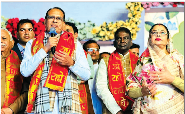
हरिभूमि न्यूज | रायसेन